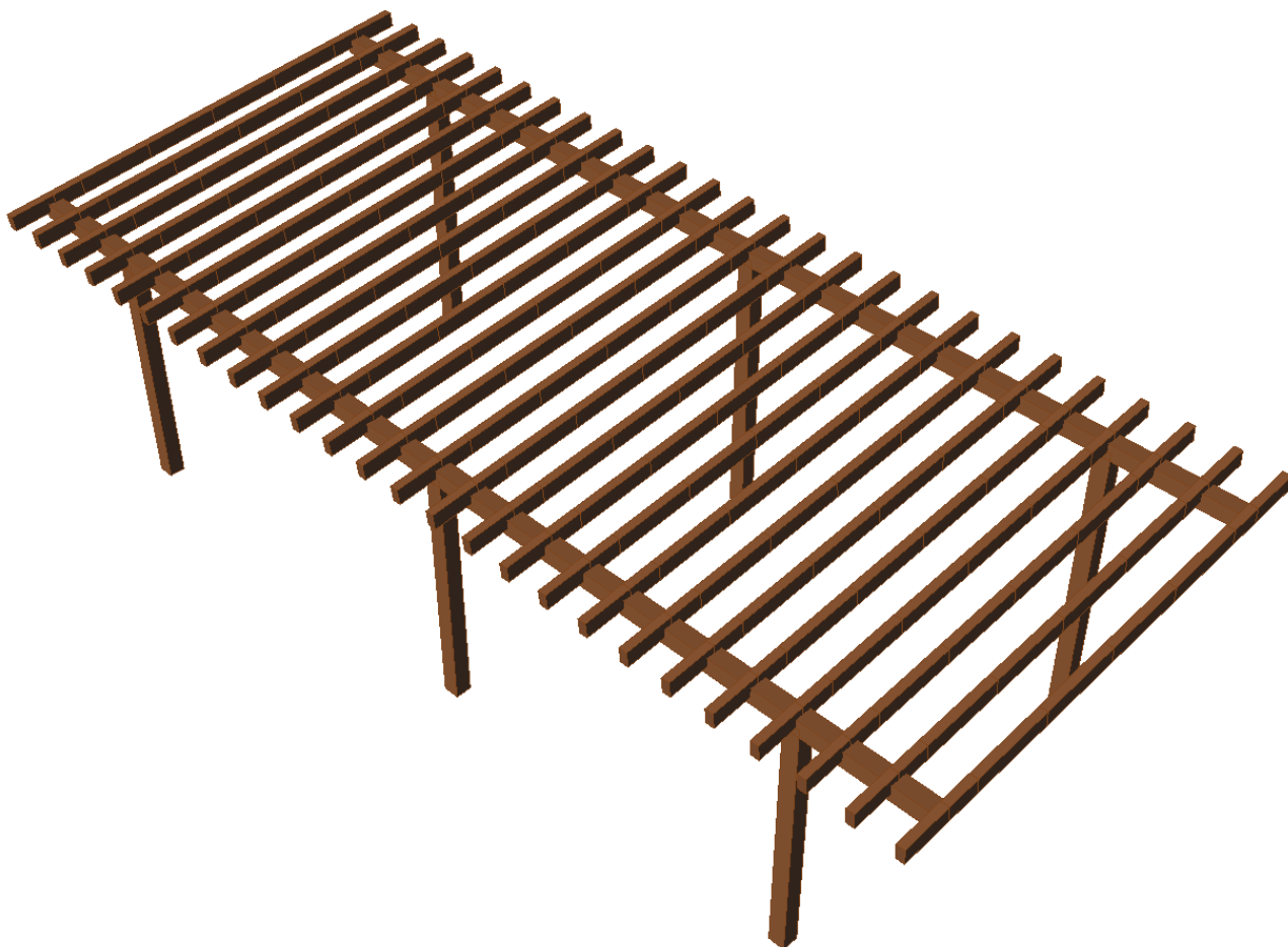
immagine del modello di calcolo della Tettoia in legno

Oggetto di questa analisi è una tettoia in Legno.